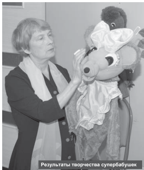
Результаты творчества супербабушек