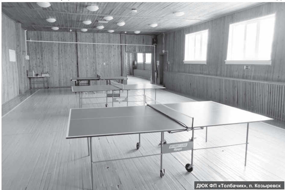
ДЮК ФП «Толбачик», п. Козыревск