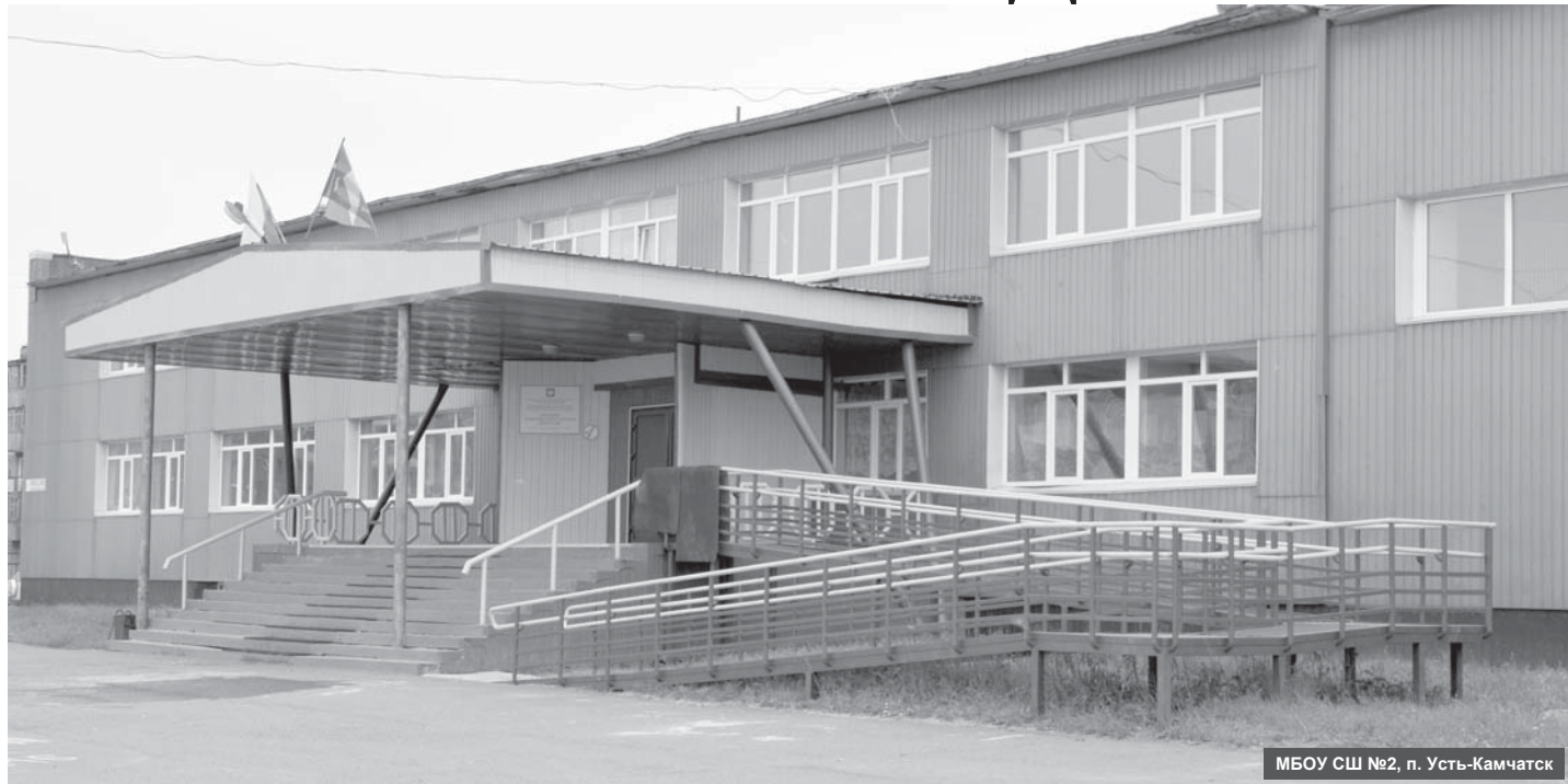
МБОУ СШ №2, п. Усть-Камчатск

В образовательных организациях Усть-Камчатского района ведутся ремонтные работы. Колоссальные средства на мероприятия по подготовке учреждений к новому учебному году выделены из муниципального бюджета.